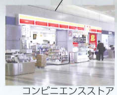
コンビニエンスストア